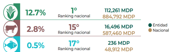
Figura 1 Aportación nacional por sector de Michoacán