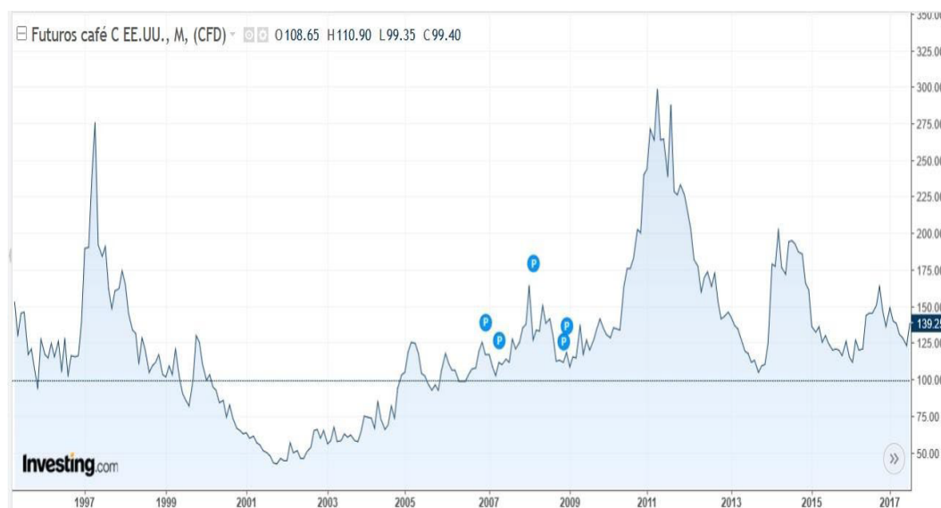
Figura 1 Precio histórico de café 2006 – 2017.

Una de las problemáticas más recurrentes cuando se habla de la industria del café es aquella que se refiere los bajos ingresos que tienen los productores, a pesar de que el café actualmente es una de las bebidas más populares y a su vez más consumidas por la población de prácticamente todas las edades y después del petróleo es la materia prima más comercializada en el mundo. Esta industria a lo largo del tiempo ha enriquecido a los tostaderos y a los comerciantes, pero tanto las personas que lo cultivan, así como las regiones donde se produce aún siguen siendo pobres y con índices muy altos de marginación, las personas que suelen tomar café llegan a pagar mucho por una sola taza sobre todo en las cadenas detallistas como Starbucks; sin embargo, de toda aquella riqueza creada en la cadena de valor del café, el productor es el que recibe la parte más pequeña, esta distribución que particularmente se muestra muy desigual es opuestamente en las prácticas y en el cuidado que los productores realizan en sus cultivos a pesar de las condiciones precarias con las que cuentan.