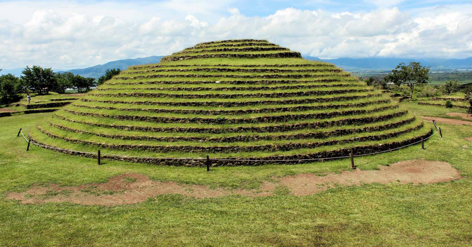
Foto: Centro Interpretativo Guachimontones “Phil Weigand”. Jalisco, México. Tomada de https://pueblosmagicos.mexico-desconocido.com.mx/