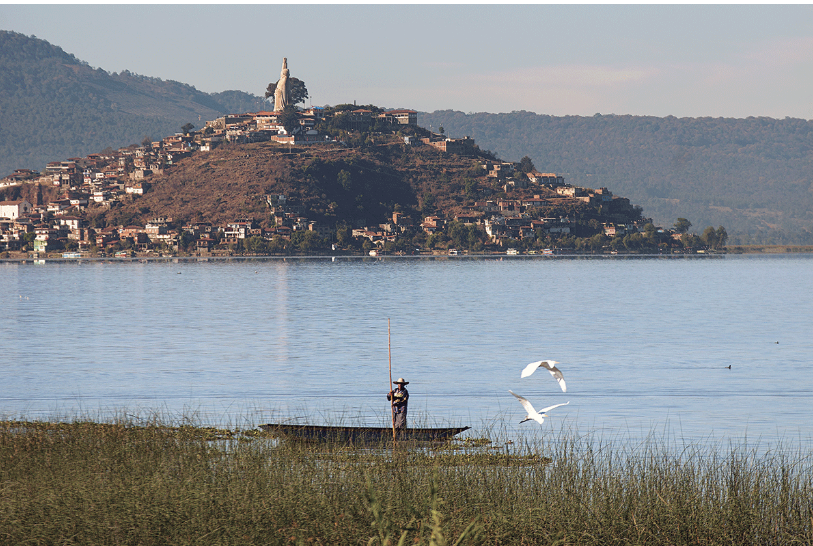
Foto:Lago de Pátzcuaro, Michoacán, Mexico.

A más de dos décadas de su creación, diversos estudios coinciden en señalar que el programa ha dinamizado economías locales, reforzado identidades comunitarias y proyectado el patrimonio cultural de México, aunque también ha enfrentado críticas relacionadas con desigual-