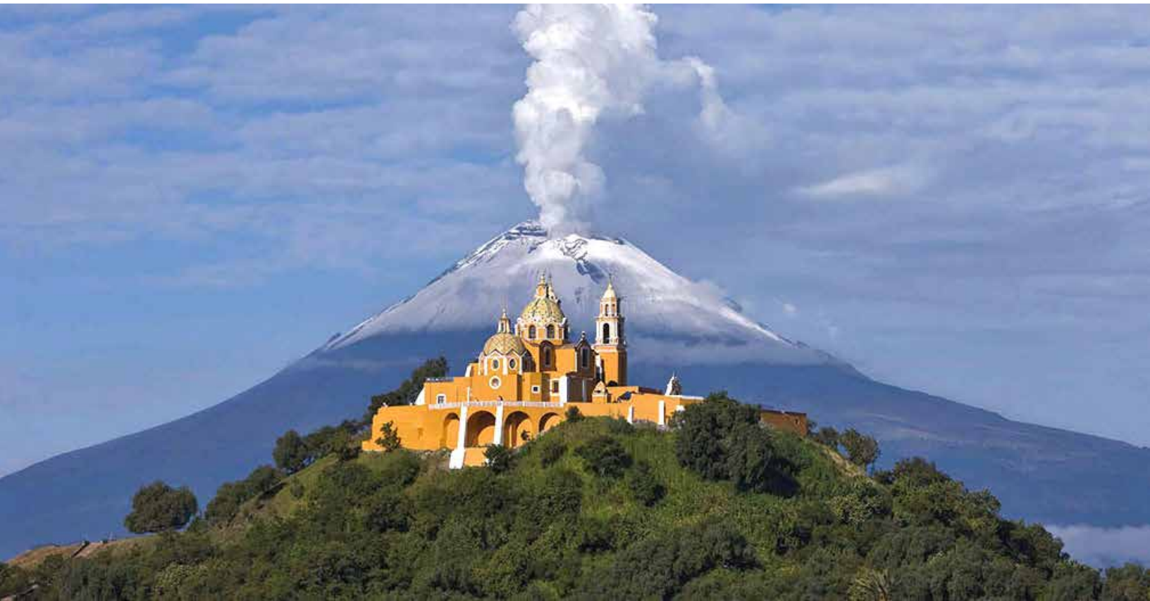
Foto: Cholula, Puebla. México.

La Secretaría de Turismo (SECTUR) es la autoridad encargada de otorgar el nombramiento de Pueblo Mágico , así como de evaluar, dar seguimiento y garantizar la permanencia de las localidades dentro del programa.