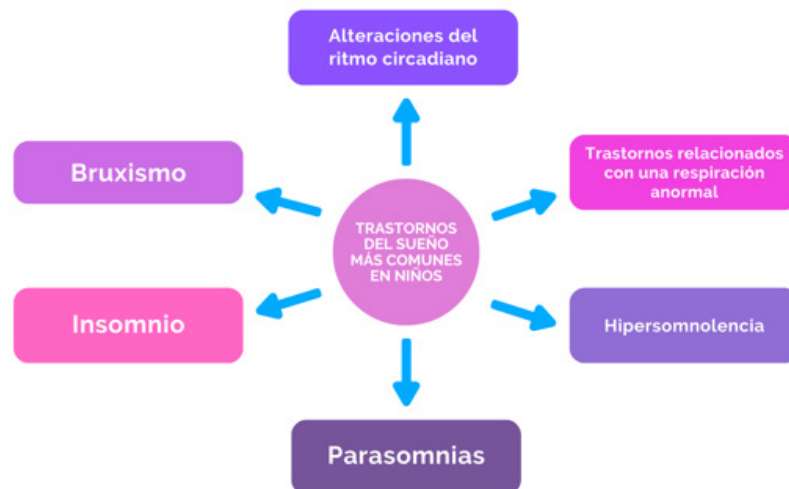
Diagrama 1. Principales trastornos del sueño en edad escolar Nota: Elaboración propia con base en Carmona et al. (2022).

de preocupación o miedo, tan fuertes que interfieren con las actividades diarias de quien las padece.