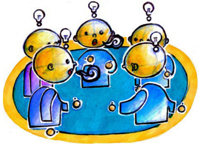
Figura 1. Comunicación asertiva.

Balcar (2014) argumenta que la comunicación asertiva (Figura 1) podría mejorar el desempeño laboral, toda vez que contribuye a mejorar las relaciones al interior de cualquier ente de carácter económico, al facilitar la comunicación consiguiendo con ello el éxito en el logro de los objetivos, aunque cabe destacar que el desarrollar habilidades transversales no es tarea fácil, resulta más complicado porque las habilidades blandas van acorde a la perspectiva de cada individuo, conectadas a sus actitu-