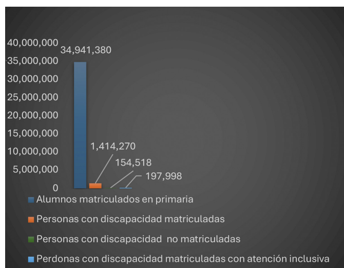
Figura 1 Exclusión educativa en México

Nota: Elaboración propia con base en CONEVAL (2024).