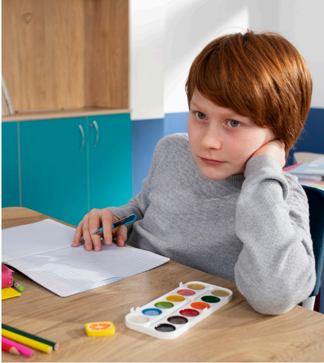
Nota. Figura tomada de Freepik.com