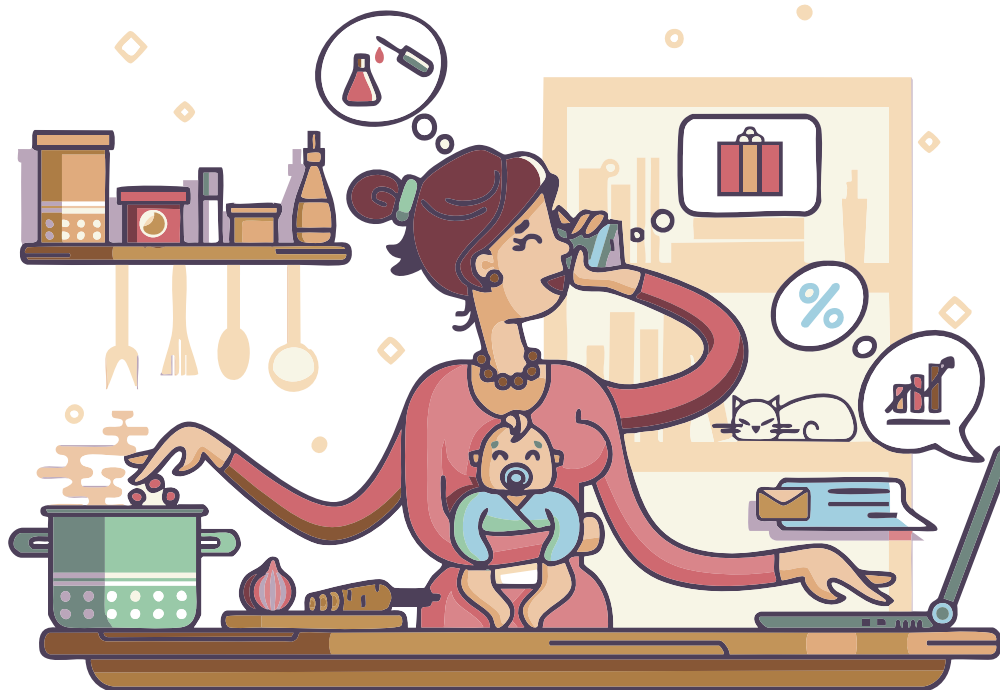
Figura 2 Mamás multitareas

Nota. Tomada de https://www.shutterstock.com/es/image-vector/busy-mother-baby-543006241