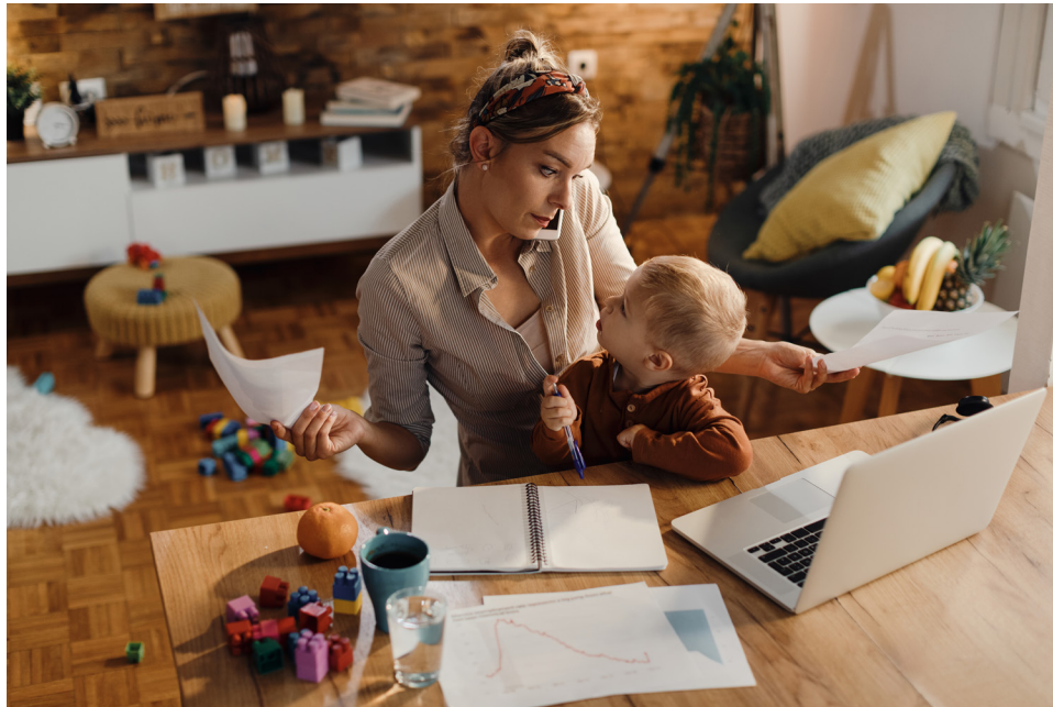
Nota. Figura tomada de Freepik.com

especialmente en un contexto donde la mujer no solo juega el papel de cuidadora, sino que también es proveedora.