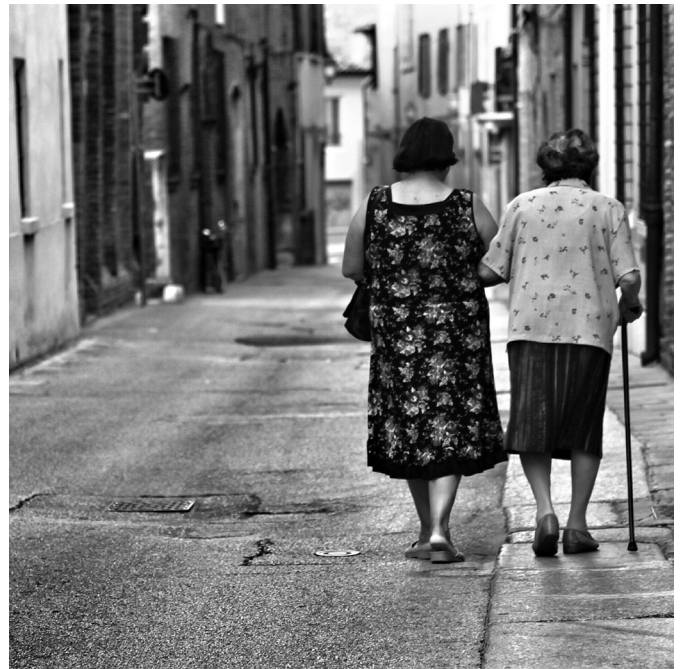
Nota. Figura tomada de Freepik.com

Es pertinente comenzar señalando que, la vejez, tradicionalmente vista como una etapa cercana a la muerte y marcada por la vulnerabilidad socioeconómica y la disminución de capacidades físicas y mentales, también aporta experiencia y sabiduría (Organización Mundial de la Salud [OMS], 2015). En México, los adultos mayores desempeñan roles cruciales como transmisores culturales, líderes morales y apoyo en la educación de sus nietos. Por otro lado, su bienestar social, según la Teoría de