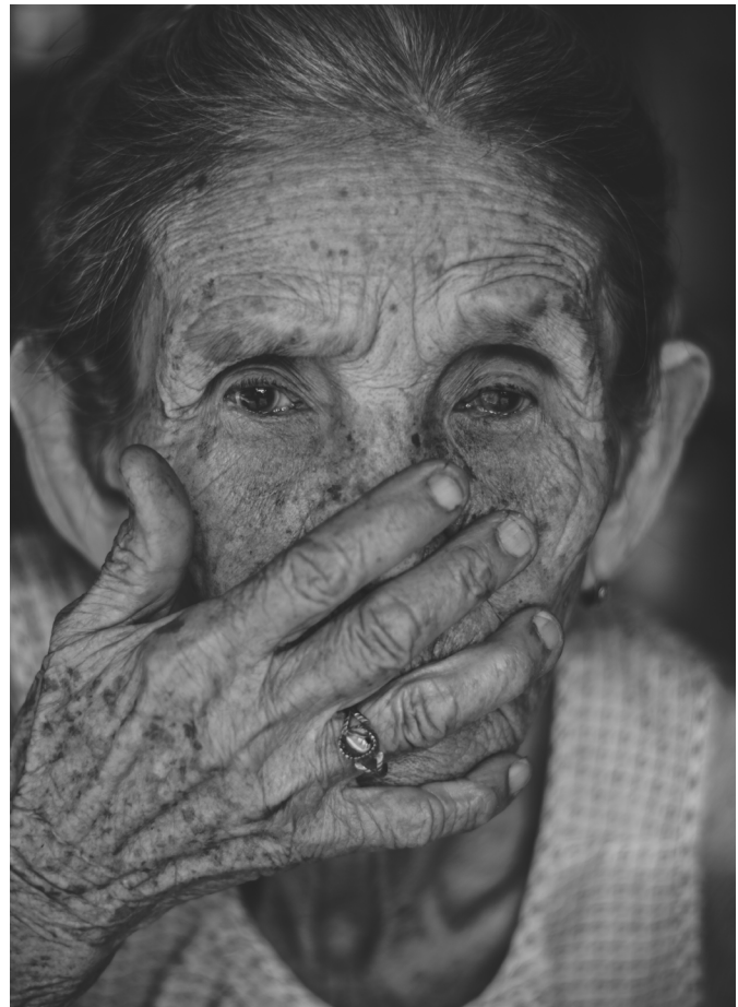
Nota. Figura tomada de Freepik.com