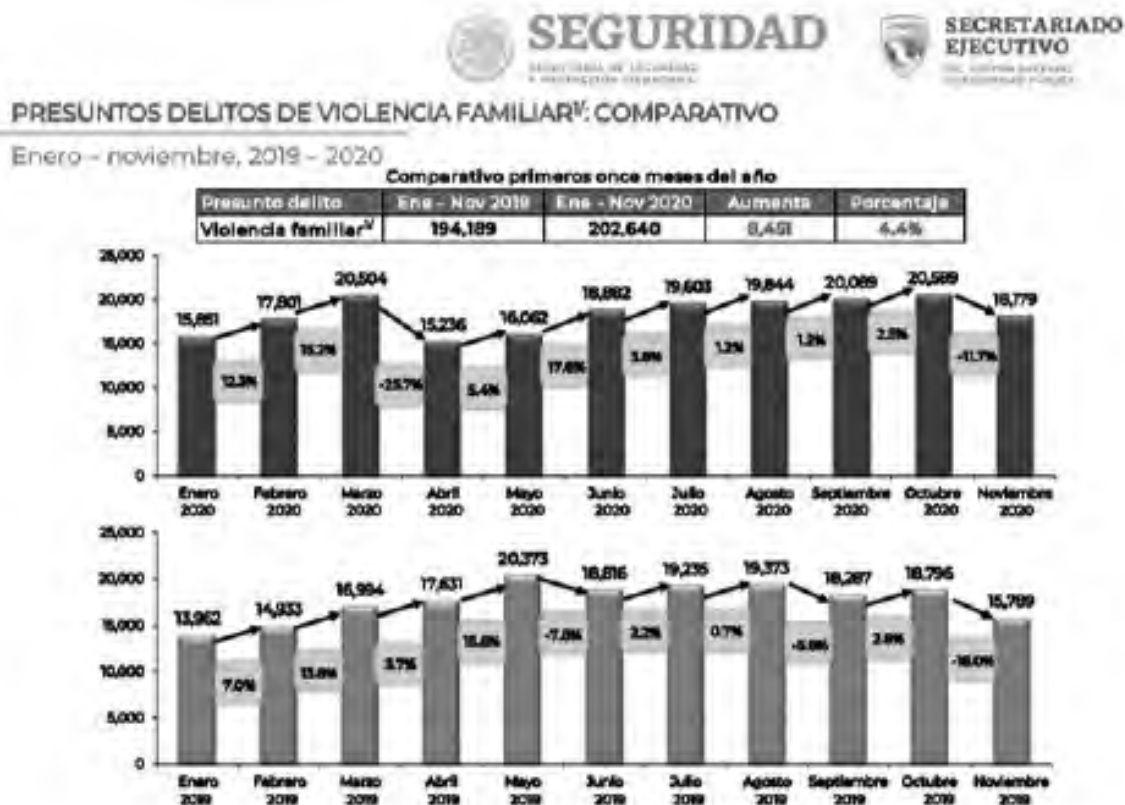
Gráfica 1. Comparativo de la incidencia nacional de violencia familiar en 2019 y 2020