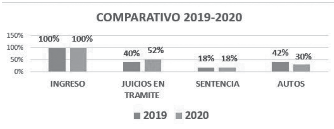
Gráfica 2. Comparativo 2019-2020: Juzgados civiles que conocieron de la materia familiar

Fuente: Elaboración propia con datos obtenidos a través de la Plataforma Nacional de Transparencia (Michoacán) con la solicitud registrada con número de folio 00109621 y expediente 73/2021, del Poder Judicial del Estado de Michoacán.