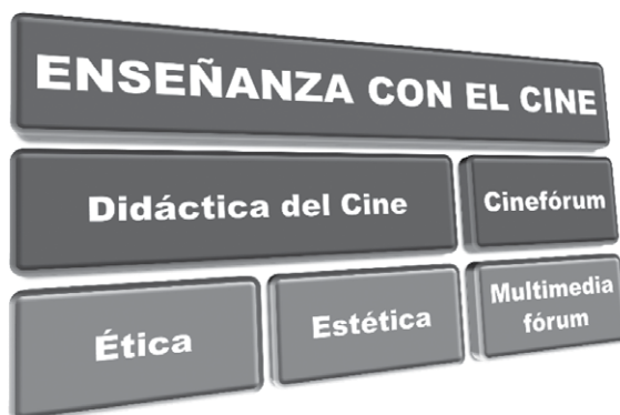
Figura 3. Enseñanza con el cine

b) Enseñanza con el cine (figura 3), que sería la utilización del cine en todas sus vertientes como apoyo a la enseñanza. Aquí se situaría la utilización de cinefórum y multimediafórum, los cine-club, y todo lo que sea el visionado de documentales, cortometrajes o películas para reforzar algún contenido curricular. En este aspecto, se estaría trabajando la didáctica del cine, y también se estaría sacando partido a la ética y la estética cinematográfica. En esta vertiente se suele utilizar cine cuyo fin principal no es el educativo.