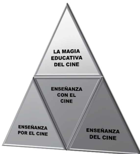
Figura 1. Vertientes de la relación cine-educación

Como señalaba Porter i Moix (1964), el cine se relaciona con la educación desde tres grandes vertientes (figura 1): la enseñanza del cine, la enseñanza con el cine y la enseñanza por el cine. En este trabajo se pretende dar valor a la tercera de las vertientes, la más creativa, la que utiliza el cine como un fin más que como un medio, ya que la finalidad es que el alumnado y el profesorado realicen sus propias creaciones audiovisuales artesanales como motor de aprendizaje.