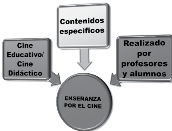
Figura 4. Enseñanza por el cine

c) Enseñanza por el cine (figura 4), que es la vertiente más creativa. Consiste en crear cine para aprender. También se puede denominar cine pedagógico o cine educativo, y el alumnado adquiere un protagonismo fundamental a la hora de diseñar y crear estos productos audiovisuales. La realización de videoclips, cortometrajes y documentales sobre temáticas objeto de estudio, pueden favorecer el proceso de enseñanza en diferentes aspectos.